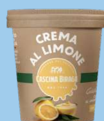
Crema al limone