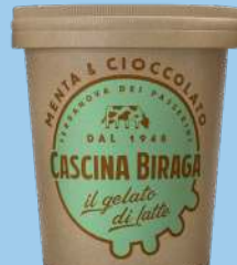
Menta e cioccolato