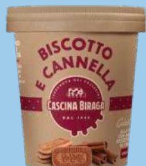
Biscotto e cannella